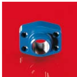
Bridas – SAE