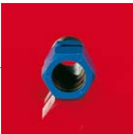
Rosca de tubo G Rosca de tubo NPT