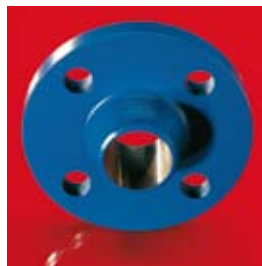
Bridas – ANSI Bridas – DIN Bridas – JIS

Conexiones personalizadas también son posibles.